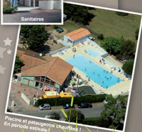
Piscine et pataugeoire chauffées ! En période estivale !

Aux Portes de l'île d'Oléron et de la Côte Sauvage, Le Camping Au Bon Air vous permettra de découvrir tous les charmes et attraits de la Charente-Maritime.